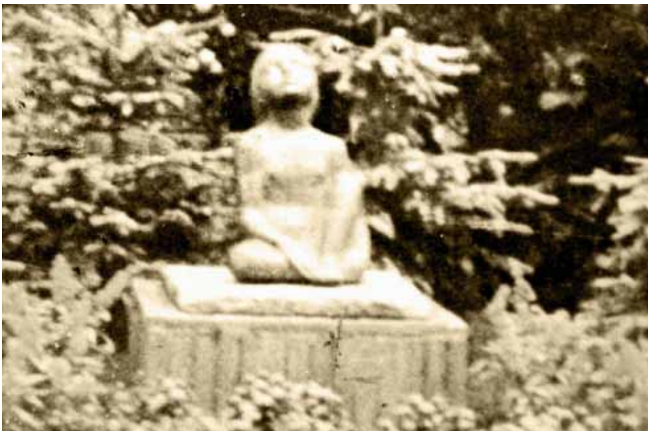
Wanderpreis des Jahres 1956 (leider zerstört)