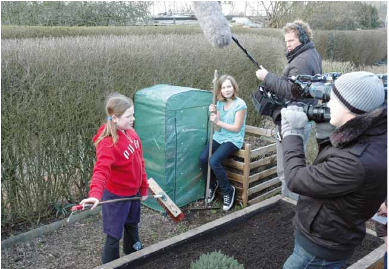
Landesweit ist das Interesse der Medien für unsere Familienzentren riesig