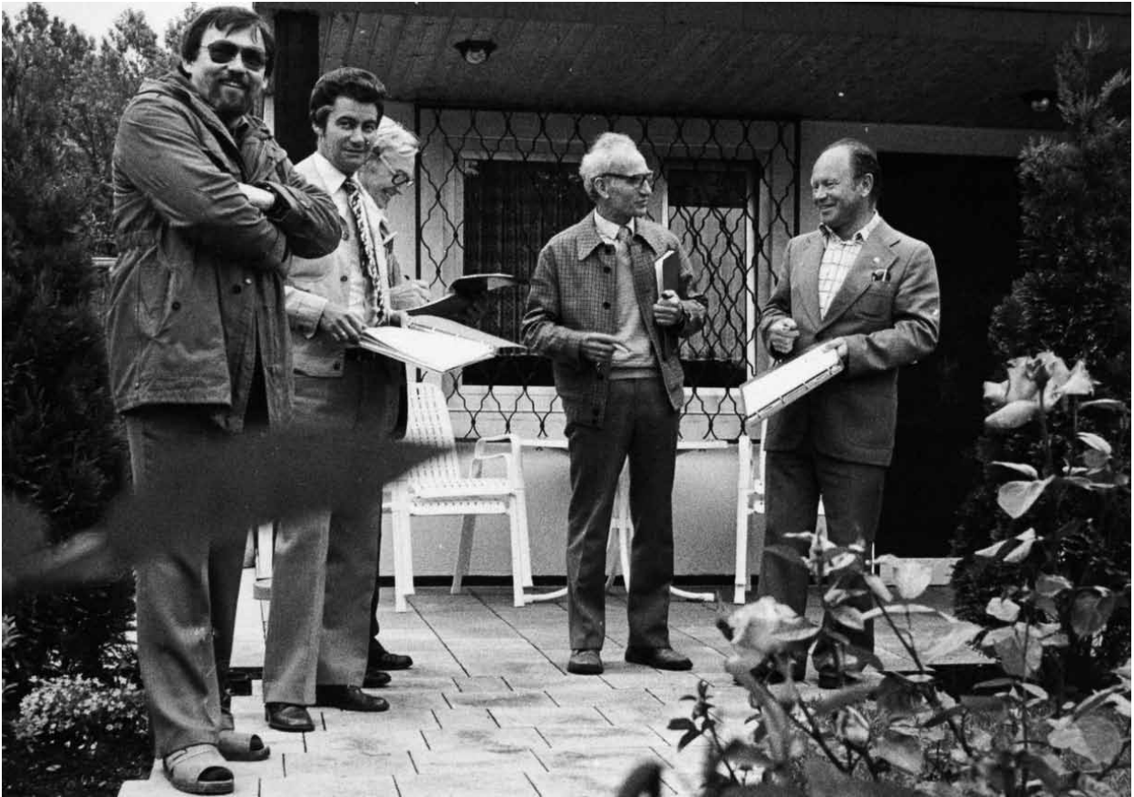
Die Jury in Begleitung im Jahre 1980