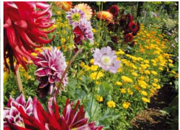
Gesammelte Eindrücke vom Kleingartenwettbewerb im Jubiläumsjahr